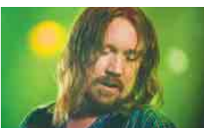
Lars Winnerbäck på Peace &amp; Love-festivalen i sommar.